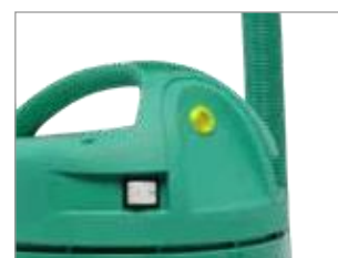
UPOZORAVAJUĆA LAMPICA ZA KONTROLU BRZINE > 20M/S