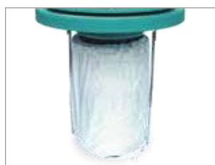
HEPA KERTRIDŽ SA POLIKARBON PREFILTEROM